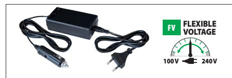
Поставляется с зарядным устройством 12 В (арт. 054684) (UK : арт. 054691)